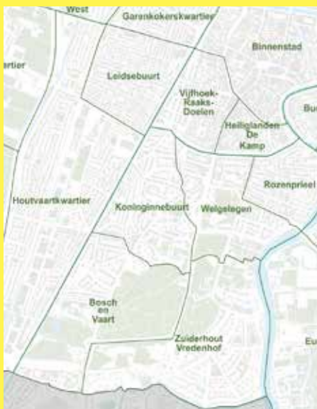
De verdeling naar wijkraden in 2022

Heeft u ook vragen of ideeën? Wilt u meepraten? Schrijf naar info@dekoninginnebuurt.nl of kom naar de jaarvergadering op woensdagavond 5 april in buurtcentrum De Baan!